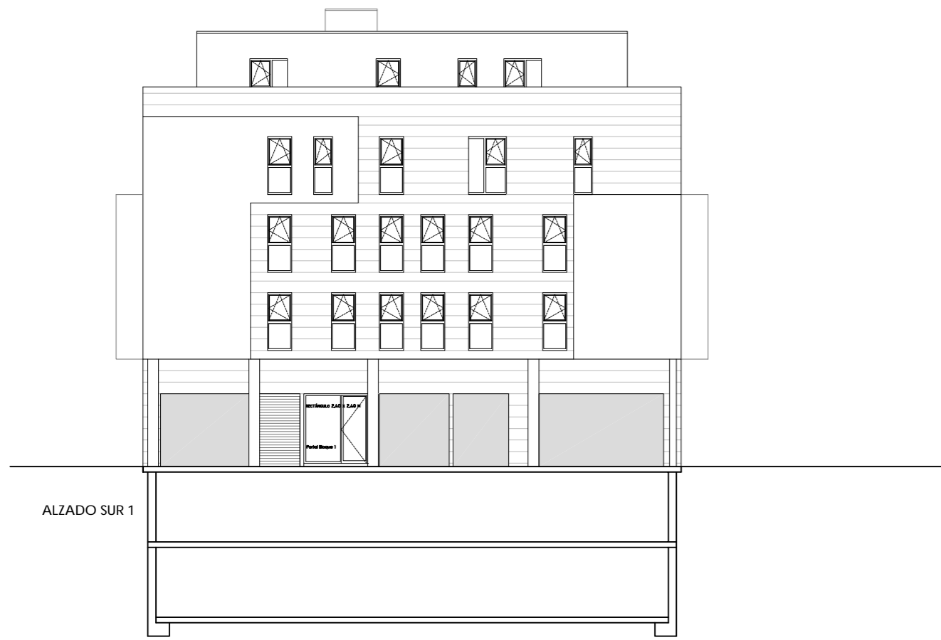
ALZADO SUR 1