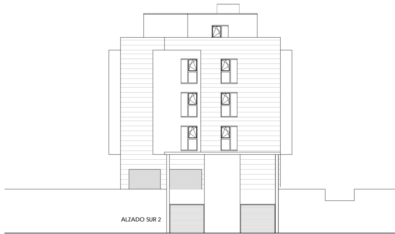
ALZADO SUR 2