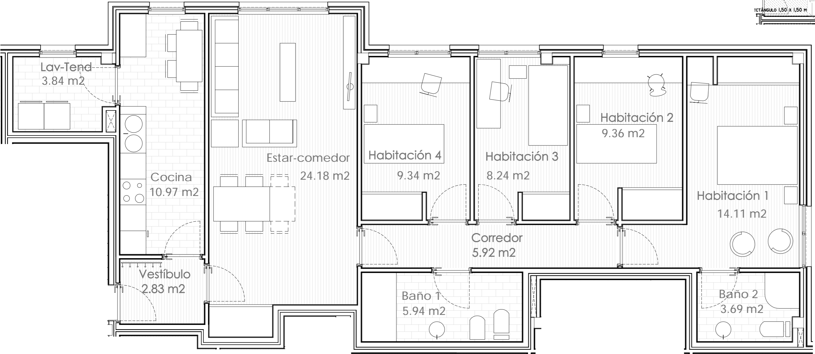
VIVIENDA B4-P1-VB, B4-P2-VB y B4-P3-VB . escala: 1/50. Usos y superficies